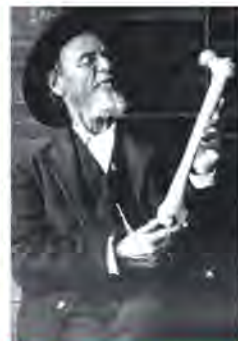
Dr. Andrew Taylor Still (1828 - 1917) Fondatore dell'Osteopatia

La storia dell'osteopata è strettamente collegata, nelle sue fasi iniziali, alla vita del dottore Andrew Taylor Still.