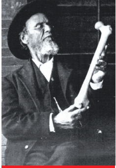
Dr. Andrew Taylor Still (1828 - 1917) Fondatore dell'Osteopatia

La storia dell'osteopata è strettamente collegata, nelle sue fasi iniziali, alla vita del dottore Andrew Taylor Still.